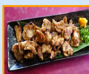
鶏ハラミ炭火焼 980円

※ 温玉 100円 ・ とろけるチーズ 100円 ※ ご飯 大盛 100円 ・ お替わり 200円 となります。 ※ お茶、水、セルフサービスにてお願い致します。