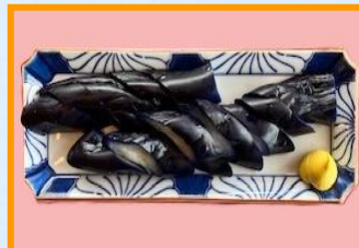
長なすの一本漬け