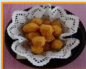
チーズの カリカリ揚げ 780円