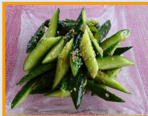
ピリ辛きゅうり 600円