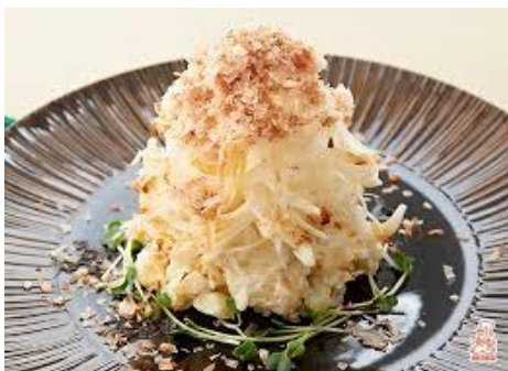
オニオンスライス 440円