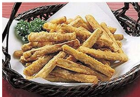
ごぼうの唐揚げ 550円